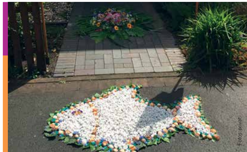
Herzlicher Empfang: Die Nachbarn hatten geschmückt.